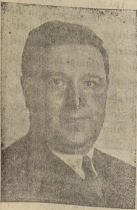
Ziraat Vekili Muhlis bey

Ziraat vekilide yakında seyahata çıkacak Erzurum ve Karsa kadar gidecek