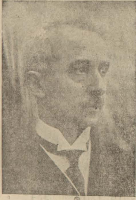
Başvekil İsmet paşa Hazretleri ut sanayi hâdisesinin başında bulunmak üzere refakatlerinde İktisat vekili ve daha bir çok zevat olduğu halde Cumhuriyet vapuruna Zonguldağa hareket edeceklerdir.

Bu merasimden sonra Başvekil hazretleri dördüncü mes-